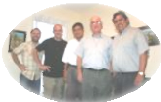
Les 2 prêtres de la paroisse Cristo Rey