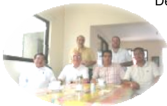
Accueil du curé de San Antonio