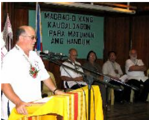
Orateur de circonstance

région pour souligner les 15 ans d'existence de l'orphelinat administré par les sœurs de « St Joseph the Worker ».