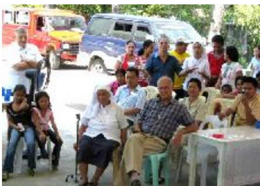
Chez les orphelins

Nous serons quatre à nous rendre à Pandan, le 27 pour la graduation