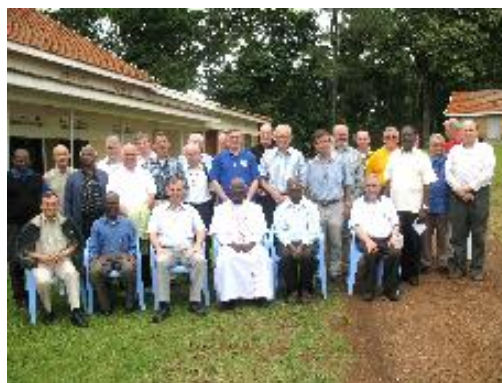
Les participants à la Conférence Générale

son message en demandant aux participants de regarder avec objectivité sur ce qui se vit, et à trouver ensemble les moyens de poursuivre la route ensemble et en communion.