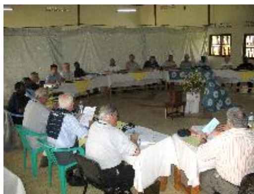
Les Supérieurs Majeurs et les Economes de l'Institut