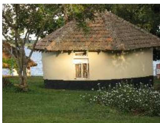
Maison des employés au Lac Victoria