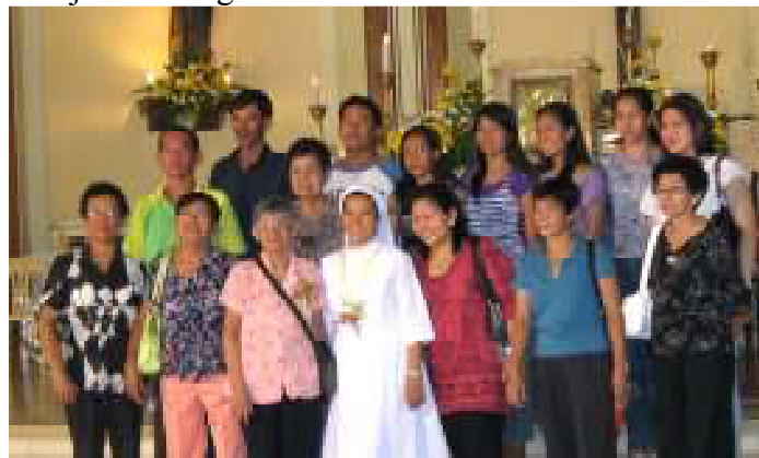
Jeune professe perpétuelle de Pandan

En milieu de semaine, les frères se joignent aux sœurs Mensa Domini pour rendre grâce au Seigneur pour les trois jeunes qui feront leur profession perpétuelle et les quatre qui souligneront leur jubilé d'argent.