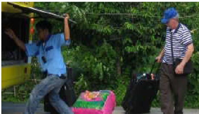
Retour de voyage