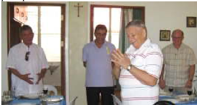
75 ans??? Jamais de la vie!